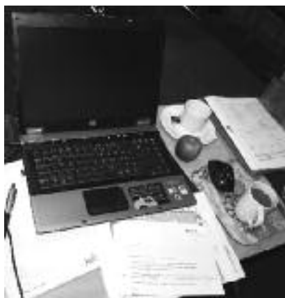
Meget skal klares samtidig.